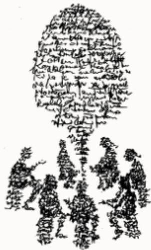
Logo Učiteljskega združenja Slovenije (oblikovanje Jirek Kočica)

Večanje pod lipo je bil star slovenski običaj, ki se je obdržal po nekaterih delih slovenskih dežel tudi po tem, ko so ukinili ustoličevanje knezov in je pomenil predvsem razsojanje o pomembnih rečeh določenega kraja.